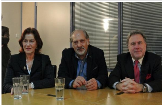
Ο Υπουργός Εργασίας κ. Γ. Κατρούγκαλος, η Αναπληρώτρια Υπουργός κ. Θ. Φωτίου με το νέο Πρόεδρο-Γενικό Διευθυντή ΕΙΕΑΔ, κ. Θ. Ζαχαρόπουλο

Θανάσης Ζαχαρόπουλος Πρόεδρος - Γενικός Διευθυντής ΕΙΕΑΔ