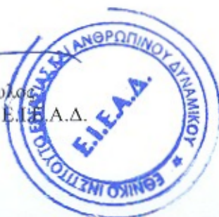
Καθηγητής Κ. Π. Αναγνωστόπουλος Πρόεδρος – Γενικός Διευθυντής Ε.Ι.Ε.Α.Δ.

..... Μετά από σχετική συζήτηση, τα μέλη του Δ.Σ., αποφάσισαν ομόφωνα , την έγκριση του συνημμένου στο παρόν πρακτικό, Ερωτηματολογίου Συμβουλευτικής των επιχειρήσεων της Πρόσκλησης Β' ανά κλαδικό σχέδιο και σύμφωνα με το επικαιροποιημένο σχέδιο της Πρόσκλησης Α', το οποίο θα απευθύνεται σε κάθε επιχείρηση και θα συμπληρώνεται από το νόμιμο εκπρόσωπό της, στο πλαίσιο του έργου «Διαρθρωτική Προσαρμογή Εργαζομένων Μικρών και Πολύ Μικρών Επιχειρήσεων που απασχολούν 1-49 άτομα, εντός της οικονομικής κρίσης» του Επιχειρησιακού Προγράμματος «Ανάπτυξη Ανθρώπινου Δυναμικού».