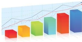
ΕΤΗΣΙΟ ΣΥΝΕΔΡΙΟ EUROSTAT

Τα τεχνικά δελτία υποβάλλονται στη διεύθυνση http://entry.eiead.gr/c .